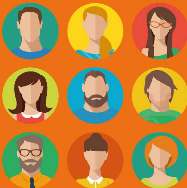
TABLE RONDE : recrutement et valorisation